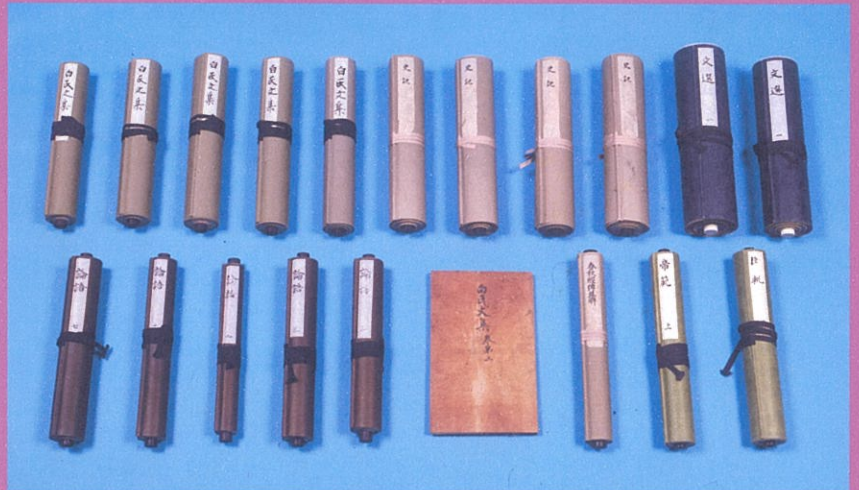
(左上)『春秋経伝集解』、(上)猿投神社漢籍 猿投神社所蔵