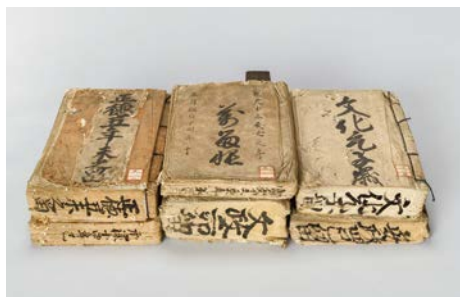
渡邊半蔵家留帳 徳川林政史研究所蔵