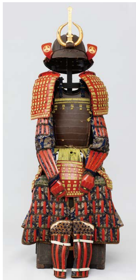
朱塗萌葱糸素懸威具足 都筑宗無（青可）所持 個人蔵