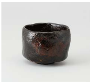
渡邊規綱（又日庵）自作黒茶碗 彫銘兵庫造