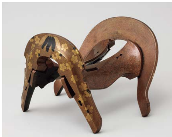
梨子地桜時絵鞍 渡邊守綱所持