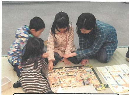
みんなですごろく！