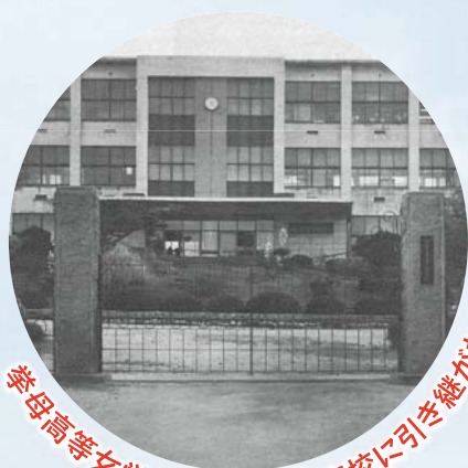
拳母高等女学校から豊田東高校に引き継がれた正門