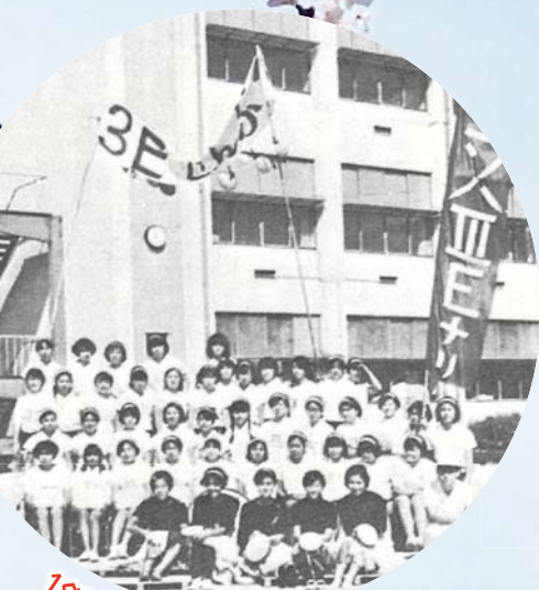
1969年豊田東高校体育祭