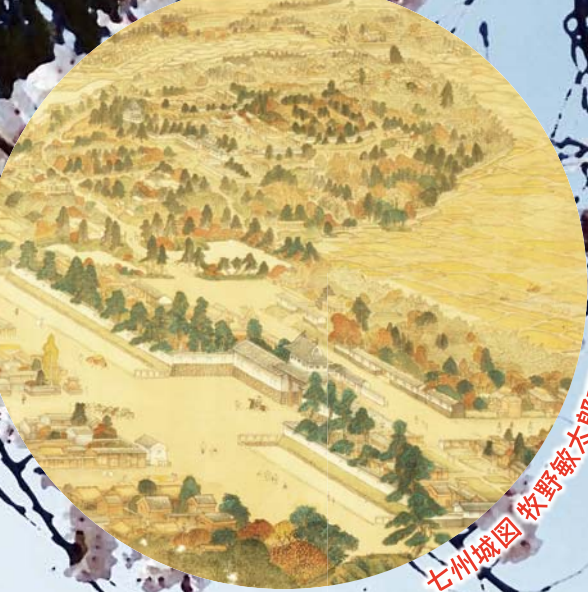
七州城図 牧野敏太郎画