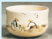
ころも焼茶碗 神成印 渡辺香堂 絵付

「愛知やまの歴史-2019」の一環として、大正・昭和期に挙母地域で製作された多彩な「ころも焼」をご覧ください。